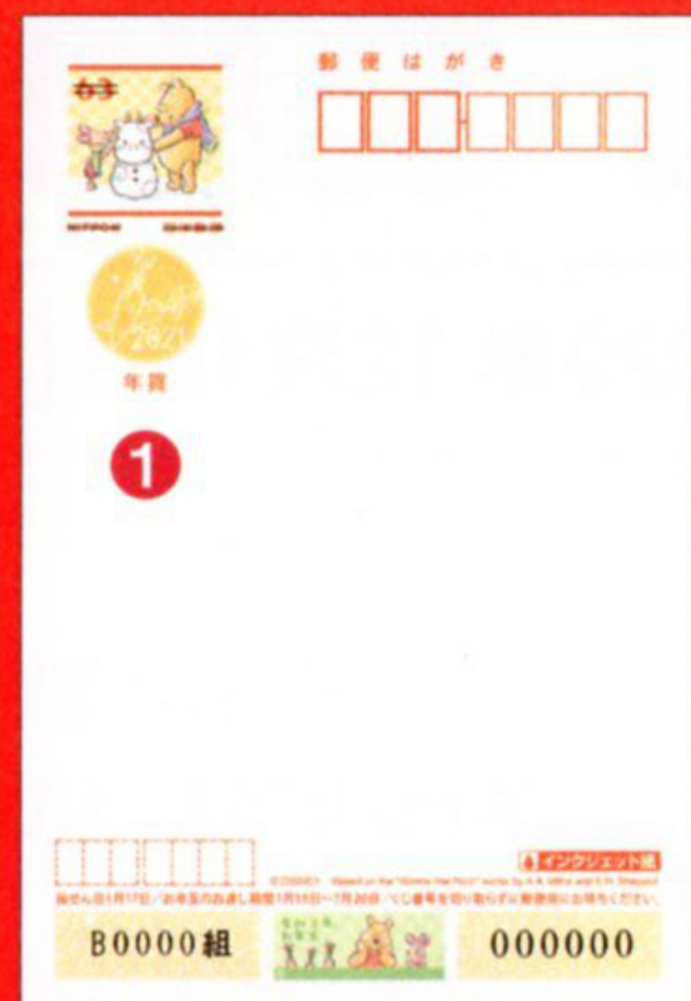
① ディズニー 年賀 (インクジェット紙) 63円 *うら面は無地です。