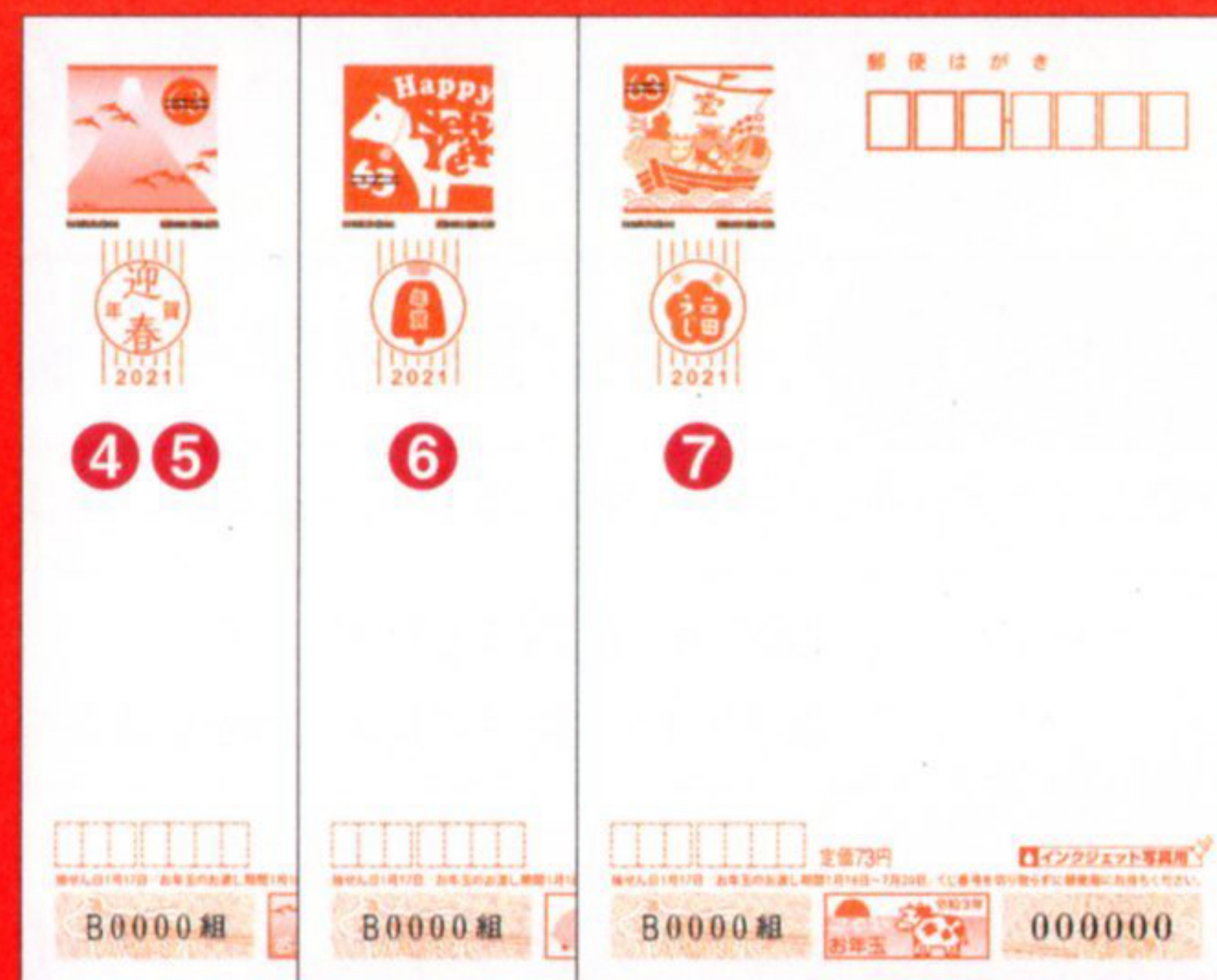
④ 無地 ⑤ 無地(くぼみ入り) 63円 ⑥ 無地(インクジェット紙) 63円 ⑦ 無地(インクジェット写真用) 73円